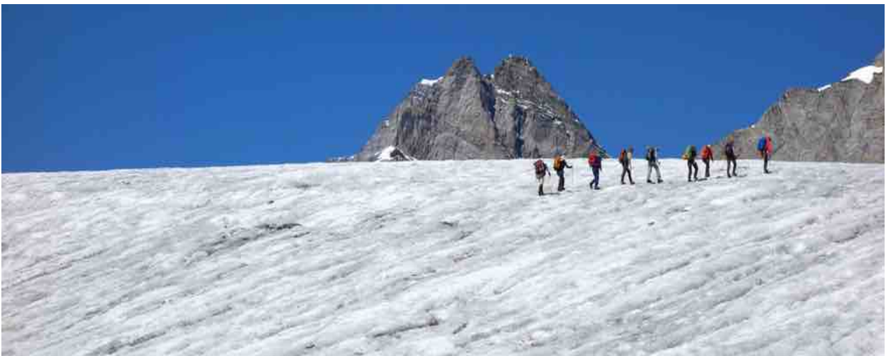
Auf dem Tschingelgletscher

Stand: November 2025. Umstellungen und Änderungen im Detail sind möglich.