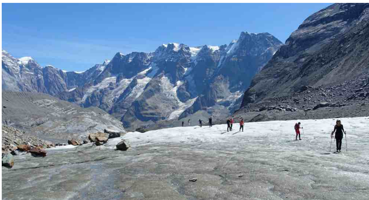
Unterwegs auf dem Tschingelgletscher im obersten Lauterbrunnental