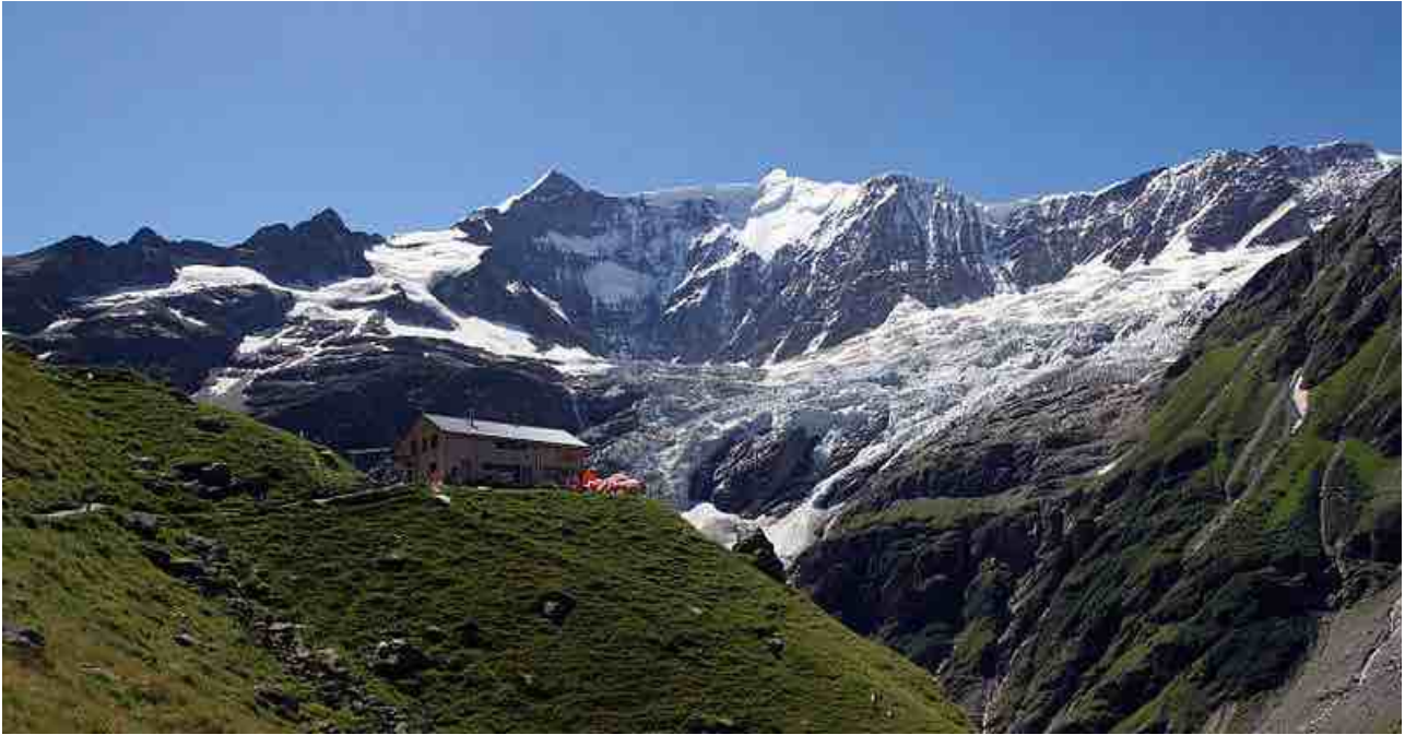
Das Berghaus Bäregg vor Ochs und Fiescherhörnern