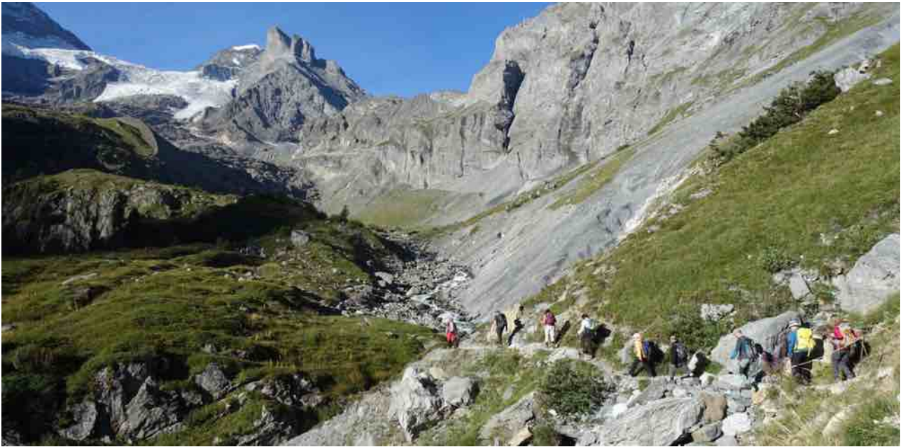
Unterwegs zum Oberhornsee im hintersten Lauterbrunnental