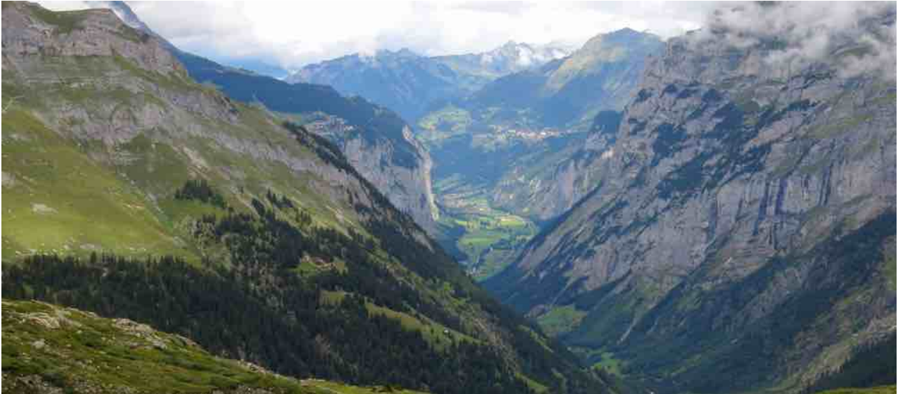
Blick vom hinteren ins mittlere Lauterbrunnental, Wengen in der Bildmitte

Nachmittag/Abend: Einstieg, Kennenlernen, Einblicke in den Tourismus von Wengen und im Welterbe.