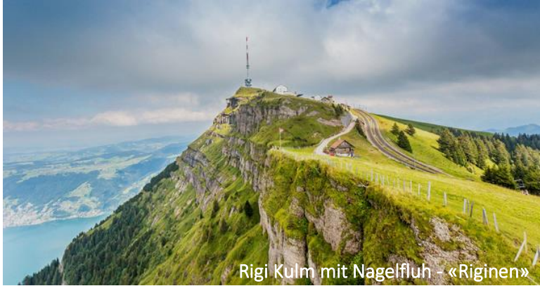
Rigi Kulm mit Nagelfluh - «Riginen»