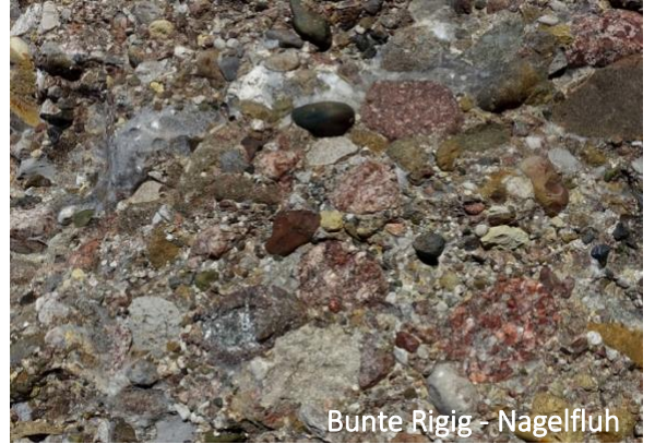
Bunte Rigig - Nagelfluh