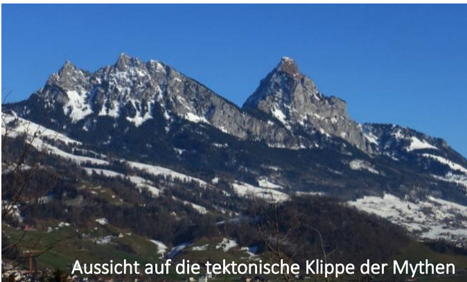
Aussicht auf die tektonische Klippe der Mythen