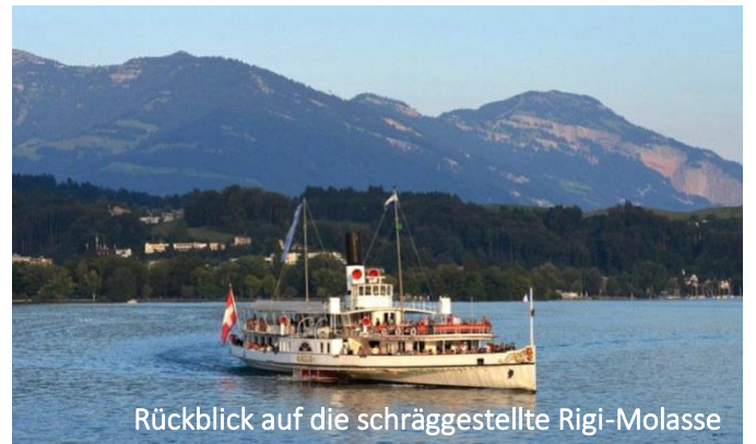
Rückblick auf die schräggestellte Rigi-Molasse